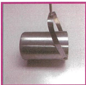
左:ディッパー<全体図> 上:可動式ディッパー <可動時>